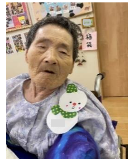
みんなで雪だるまの壁掛けを作りました。