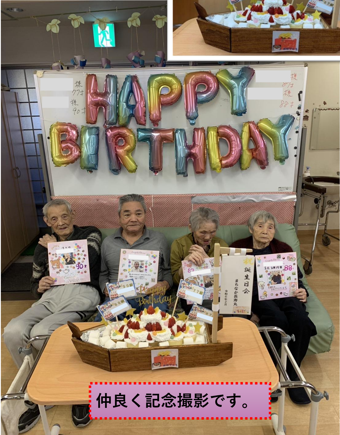
仲良く記念撮影です。