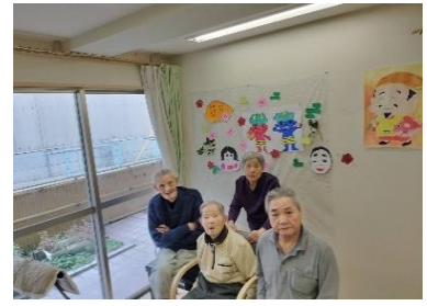
節分に豆撒きをしました。