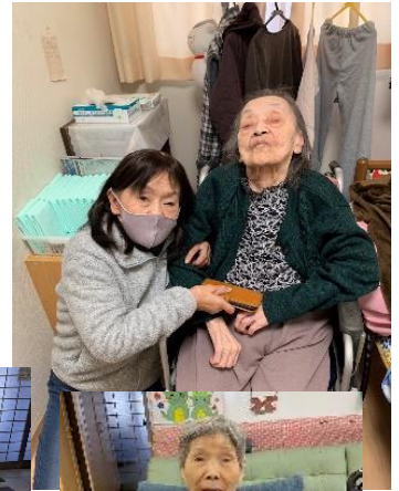
利用者様の娘さんが面会に。お寿司とおはぎを差し入れ。